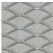
Natural grey, NCS